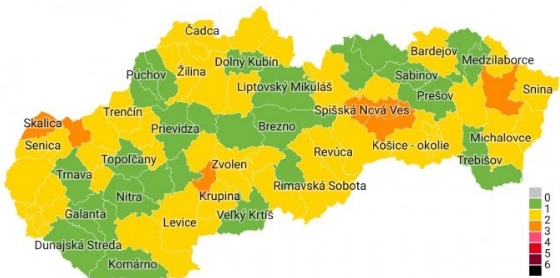
Obr. 1 – COVID automat - platný od 28.6.2021